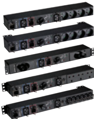
Gamme HotSwap MBP