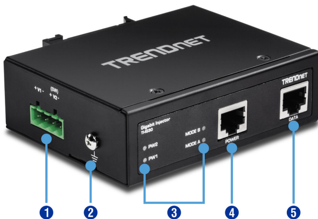
Illustration Eines Network

LED-Leuchten zeigen PoE- und Netzwerkverbindung an