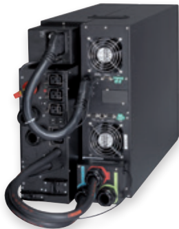
Eaton 9PX 11kVA mit Wartungsbypass

Die 9SX ist eine Energy Star® qualifizierte USV