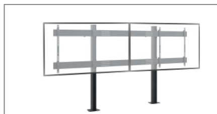
Für 2 Bildschirme „side-by-side“