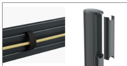
Kabelmanagement entlang der Rails und Säulen