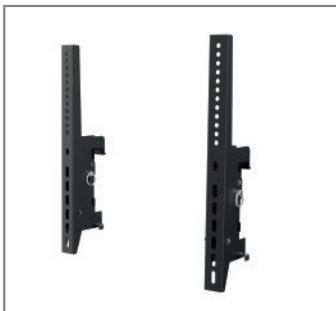
VESA-Arme, 0 - 20° neigbar