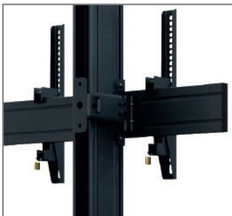
Tiefe variabel einstellbar

Die Komplettlösungen sind mit den Einzelkomponenten der comPROnents®-Serie uneingeschränkt kombinierbar und erweiterbar und bieten so weitere Einsatzmöglichkeiten.