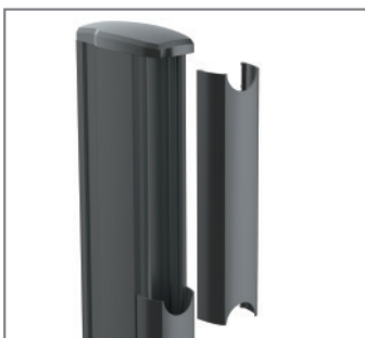
Kabelmanagement entlang der Rails und Pillars