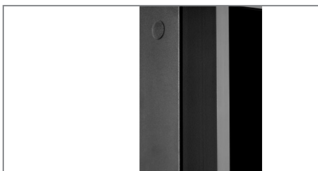
schlag- und kratzfeste Pulverbeschichtung