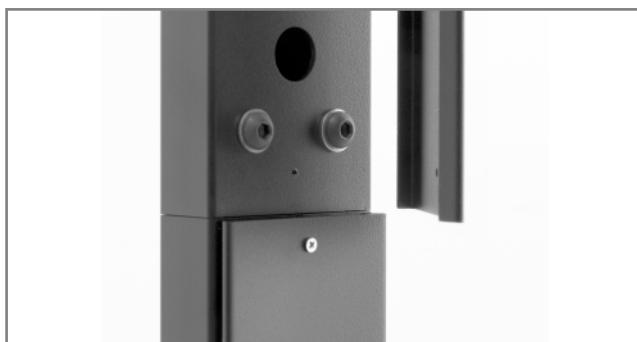
Kabelführung innerhalb des Rahmens und der Tragsäulen